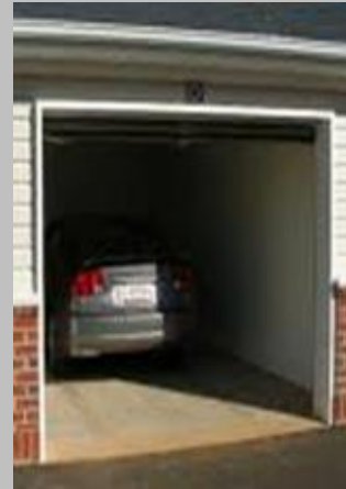
Motorji z notranjim zgorevanjem

V prostoru pride v največ primerih do nastanka prevelikih koncentracij CO zaradi: