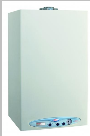
Plinske peči in bojlerji