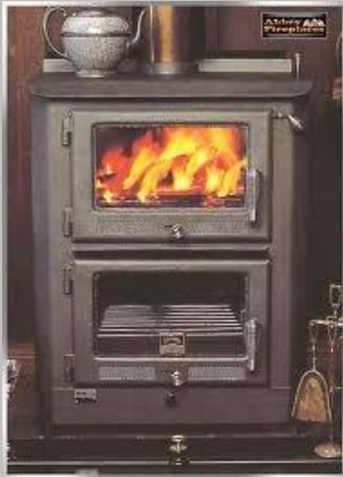
Peči na trdna goriva, naftne derivate (kurilno olje, bencin, petrolej)